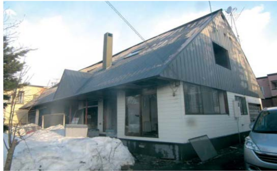
グループホームみらいとんでん