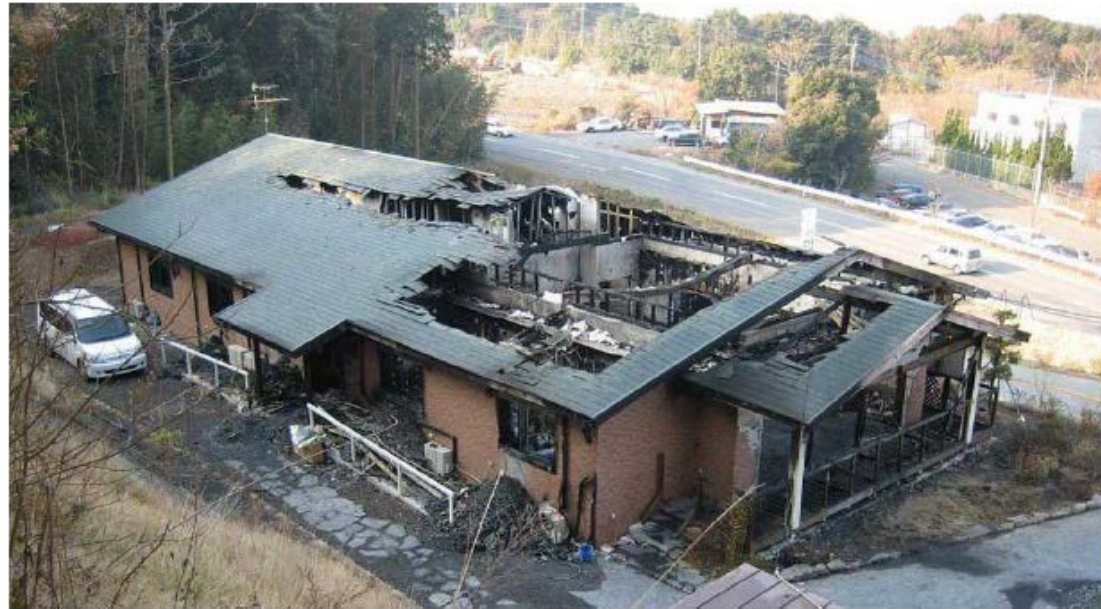
火災発生後の「やすらぎの里さくら館」の外観